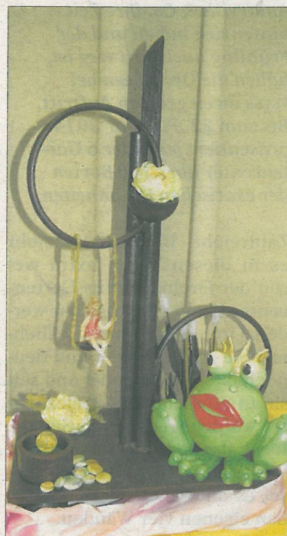
Fantasie aus Schokolade und Marzipan

Dieses Jahr wurden Aufgaben zu den Themen Valentinstag, Ostern, Olympische Winterspiele in Sotschi gestellt. Die Vielfalt der Ergebnisse wird wieder sehr gross, bunt und fantasievoll sein. Ein Besuch lohnt sich auf jeden Fall. Einen kleinen Vorgeschmack liefern wir Ihnen mit Werken aus dem Vorjahr.