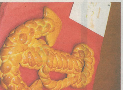
2. Rang, Fachrichtung Bäckerei, 3. Lehrjahr: Raffaella Kalt, Gunzenhauser, Sissach.