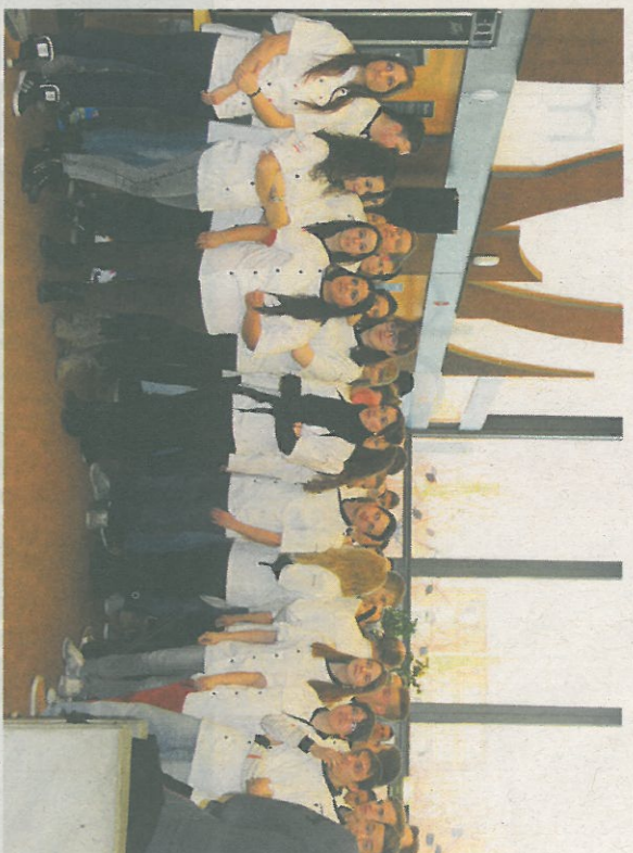
Die Bäcker-Konditor-Confisereur-Lernenden warten auf die Rangverkündigung in der Aula der Gewerblich-industriellen Berufsschule in Muttenz.